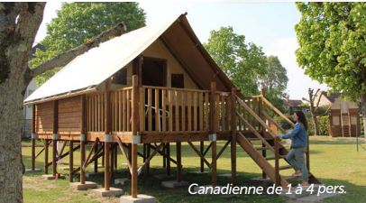
Canadienne de 1 à 4 pers.

Lodges Cepoy