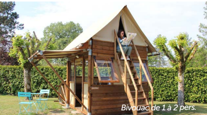
Bivouac de 1 à 2 pers.