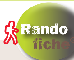
Le moulin du Lazais