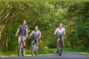
Dans les bois