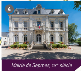
Mairie de Sepmes, XIX e siècle