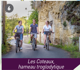
Les Coteaux, hameau troglodytique