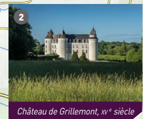
Château de Grillemont, XV e siècle