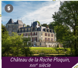
Château de la Roche Ploquin, XVIII e siècle