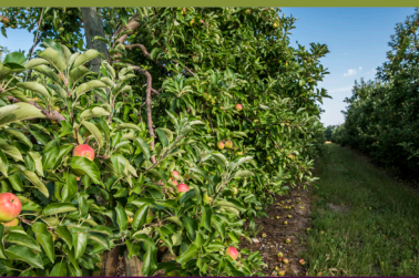
Les Vergers de la Manse

Take advantage of the scenic routes around Les Coteaux and Sainte Maure de Touraine. Discover other cycling loops and further information on interesting places to visit on our web site : www.loches-valde Loire.com .