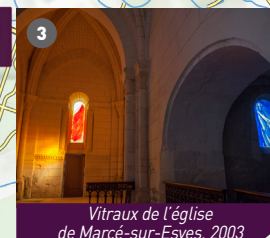
Vitraux de l'église de Marcé-sur-Esves, 2003