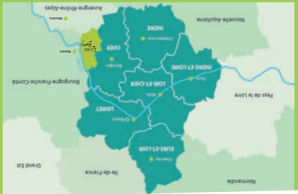
CIAP la Tuilerie La Guerche-sur-l'Aubois