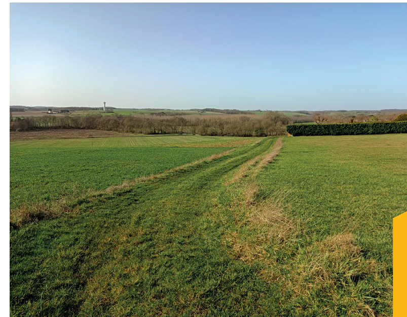
Vue de Beaumont vers la Brenne et Neuillé-le-Lierre

4 POINT DE VUE SUR LA VALLÉE DE LA BRENNÉ