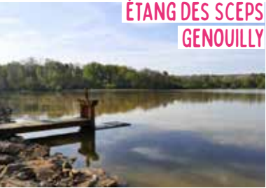
ÉTANG DES SCEPS GENOUILLY