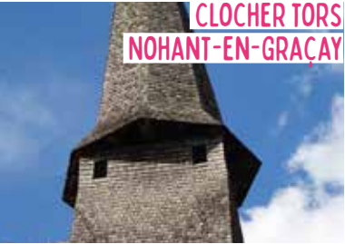
CLOCHER TORS NOHANT-EN-GRAÇAY

Lorsque vous traverserez ce « plat pays » qui, dit-on garde « l'horizon pour poème », vous ne manquerez pas d'être surpris par cette singularité culturelle : à l'horizon, les clochers tors. Que leur forme soit intentionnelle ou accidentelle, nul ne reste indifférent à cette particularité architecturale : de quoi vous faire tourner la tête !