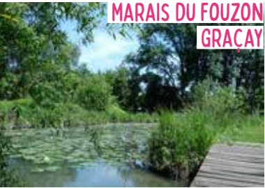
MARAIS DU FOUZON GRAÇAY