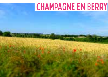
CHAMPAGNE EN BERRY

Les vastes étendues de la Champagne en Berry n'attendent qu'une chose : vos yeux grands ouverts sur l'histoire de ce monde rural. Ici, les mots des géographes s'effaceront pour laisser place à l'impression que provoque l'étendue de cet espace.