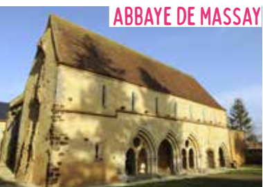
ABBAYE DE MASSAY