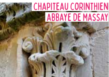
CHAPITEAU CORINTHIEN ABBAYE DE MASSAY