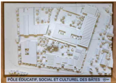
Vue en hauteur de la maquette

Cette nouvelle création a pour objectif de permettre au public de visualiser les futurs aménagements du pôle éducatif et socio-culturel du quartier des Bâtes en cours de construction. Un projet à 30,7 millions d'euros qui s'inscrit dans le cadre du Nouveau Programme de Rénovation Urbaine (NPNRU) Bâtes-Tabellionne.