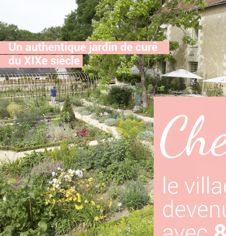
Un authentique jardin de cure du XIXe siècle