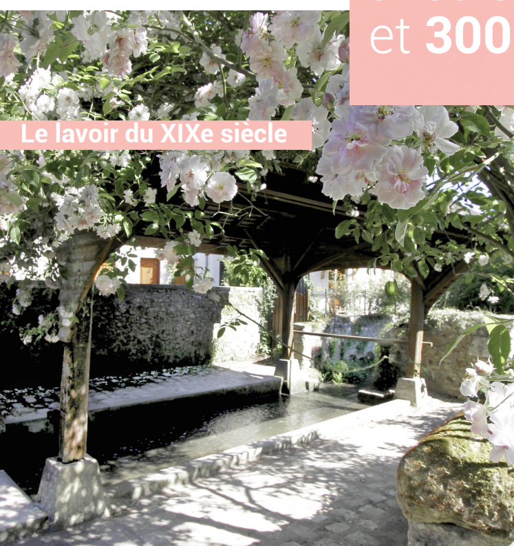
Le lavoir du XIXe siècle

Chédigny le village devenu jardin avec 800 rosiers et 3000 vivaces