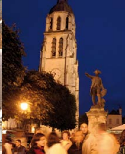
Das Glockenspiel im Turm Saint-Martin ertönt Stunde um Stunde und schlägt dem Herzen von Vendôme den Takt.