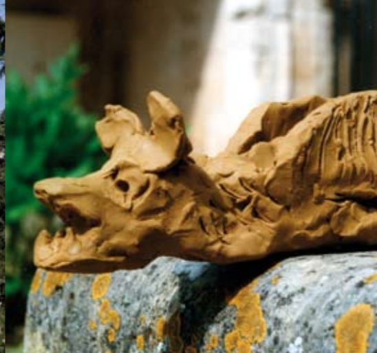
Wasserspeier aus Ton, von Kindern in einem Workshop modelliert.