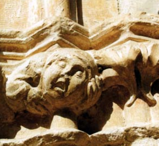
Skulptur im Kapitelsaal.

Wer sich die Zeit nimmt, durch Straßen und Gassen schlendert, seinen Blick schweifen lässt, dem bringen historische Bauten und Plätze die Geschichte der Stadt nahe.