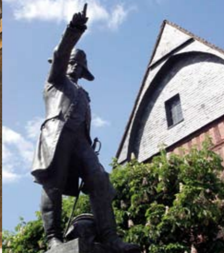
Der Marschall von Rochambeau, geboren im "Vendômois", Statue von F. Hamar.