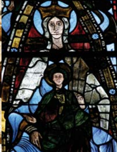
Die Jungfrau mit dem Kind, Kirchenfenster um 1125 in der Abteikirche Trinité.