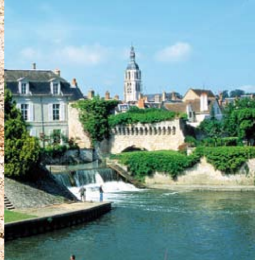
Das Wassertor oder "Arche(Bogen) des Grands-Prés" über dem Loir.