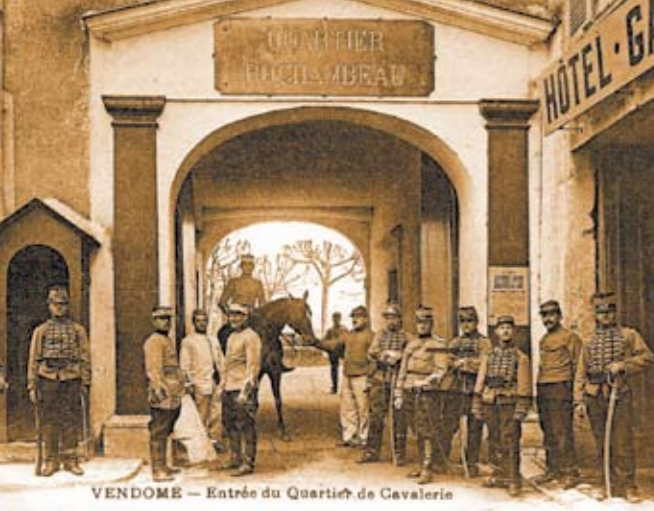
Soldaten des 20. Regiments der "Chasseurs à cheval" vor der Rochambeau-Kaserne, ehemalige Abtei Trinité.

Von der ehemaligen Benediktinerabtei bis zu den Toren der Stadt erzählen Ihnen malerische Orte ihre Geschichte.