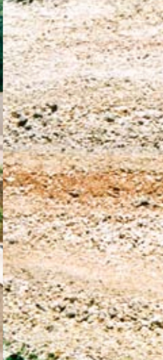
Kalkgestein am Südhang.