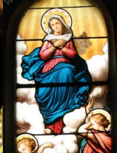
Kirchenfenster aus dem 19.Jh.: die Himmelfahrt Mariä, vom Atelier Lobin, Madeleine-Kirche.