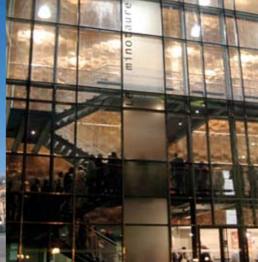
Detail der Kupferwand des Minotaure, Veranstaltungssaal, der von Goëlle Péneau entworfen wurde.