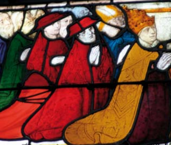
Kardinäle und Mönche, Detail eines Kirchenfensters der Abteikirche Trinité.

Um den ruhigen Verlauf einer Gerichtsverhandlung während der Revolutionszeit zu gewährleisten, wird Vendôme ausgesucht, da es mehr als 120 Km von Paris entfernt liegt und wird somit Schauplatz des Sondergerichtshofs im Prozess gegen Gracchus Babeuf und Augustin Darthé samt ihrer Anhänger. Sieben Monate dauern die hitzigen Verhandlungen und heftigen Debatten, die die gesamte Stadt erregen. Schließlich werden die beiden Hauptangeklagten hingerichtet und die meisten ihrer Sympathisanten deportiert. Das Jahr 1786 bedeutet zwar das Ende der Anführer der "Verschwörung der Gleichen", aber ihre Ideen werden nach der Revolution von 1830 eine neue Blüte erfahren.