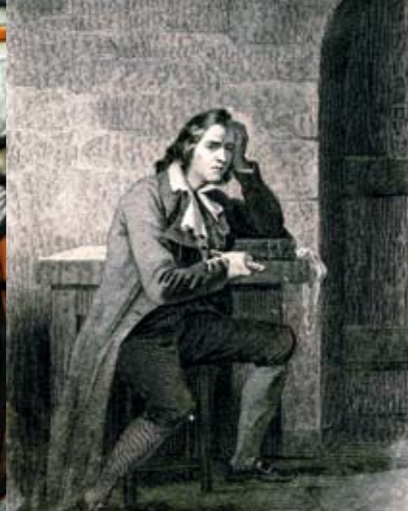
Gracchus Babeuf, einer der Anführer der "Verschwörung der Gleichen", wurde am Ende seines Prozesses im Mai 1796 in Vendôme verurteilt und hingerichtet.