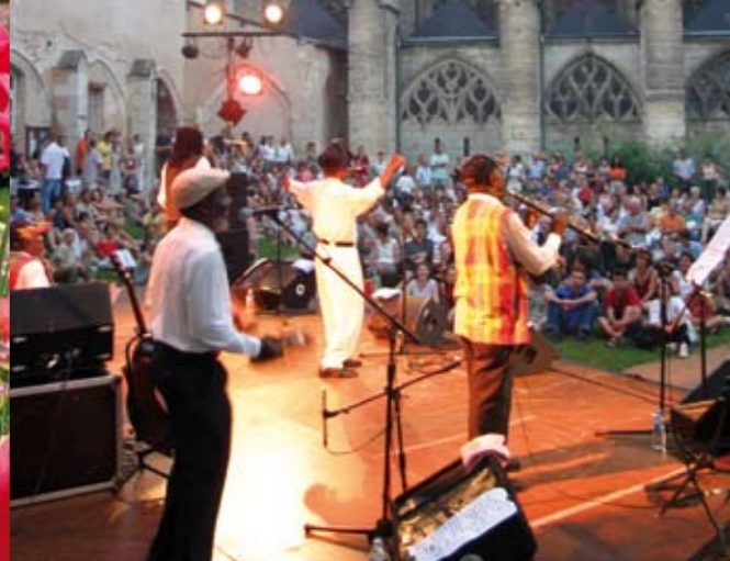
Der Platz Saint-Martin, im Herzen der Stadt.