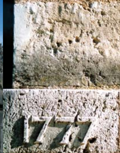
Detail am ehemaligen "Collège des Oratoriens".