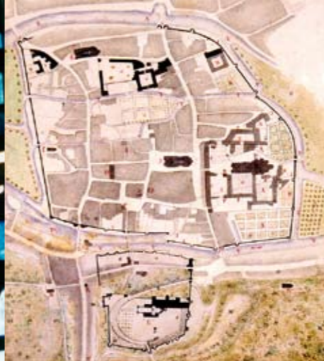
Vendôme im 17. Jh., von Gervais Launay im 19. Jh. gemalt.