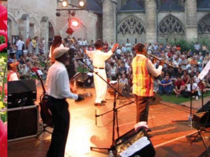
Concert des Rendez-vous de l'été.