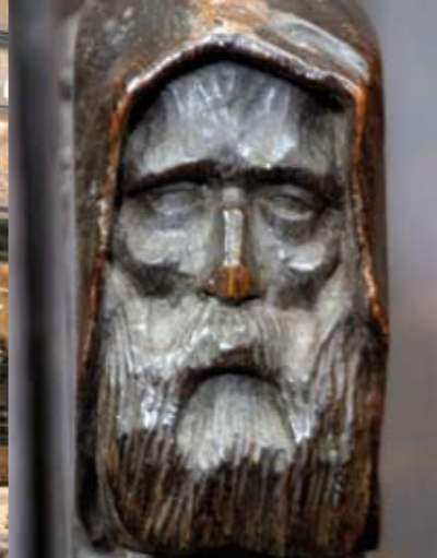
Moine sculpté des stalles de la Trinité.