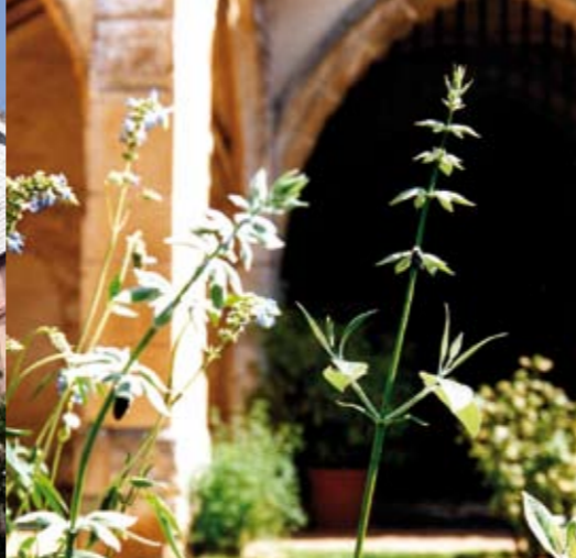
De nombreuses variétés botaniques (ici une salvia discolora) s'épanouissent dans le jardin de senteurs de la cour du Cloître.