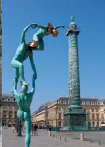
L'hôtel particulier des ducs de Vendôme, bien que détruit lorsque la place royale est aménagée à la fin du XVII e siècle, donne son nom à la place parisienne.