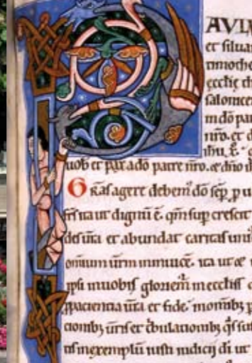
Un des 232 manuscrits médiévaux conservés à la bibliothèque de Vendôme. Commentaire des épîtres de saint Paul (Ms 23 - F.165 - XII e siècle).