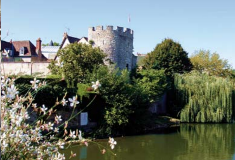
La tour de l'Islette.