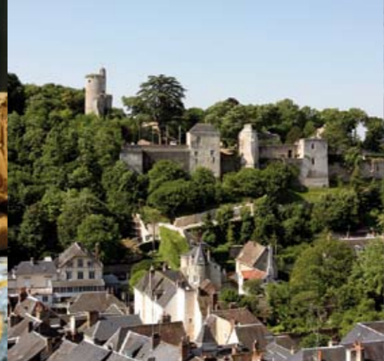
Sur le coteau sud, le château et son parc dominent la ville.