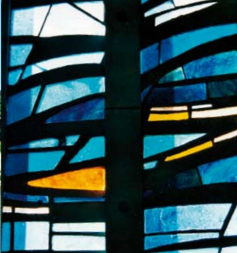
Vitrail contemporain par Anne Huet, église Notre-Dame-des-Rottes.