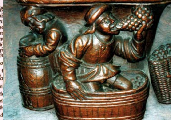
Vignerons sculptés à la fin du XV e siècle dans les stalles de la Trinité.