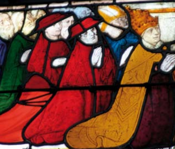
Cardinaux et religieux, détail d'un vitrail de l'abbatiale de la Trinité.

En 1371, après la mort du comte Bouchard VII et de sa fille Jeanne, Catherine de Vendôme, respectivement leur sœur et tante, hérite du comté de Vendôme. Son mariage avec Jean de Bourbon-la-Marche donne naissance à la maison de Bourbon-Vendôme. Cette dynastie marque l'histoire du comté puis duché à partir de 1515. Ainsi, la comtesse Marie de Luxembourg (1462-1546), fille de Pierre de Luxembourg et de Marguerite de Savoie, après la mort de son époux François de Bourbon, joue un rôle de mécène durant un demi-siècle.