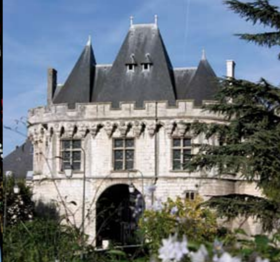
La porte Saint-Georges abrite, depuis 1467, les réunions de l'assemblée municipale.