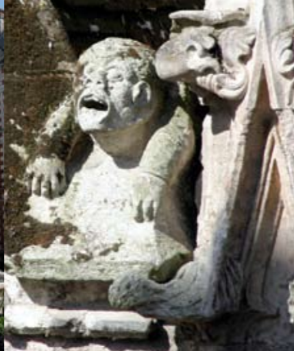
Détail sculpté de la chapelle Saint-Jacques.