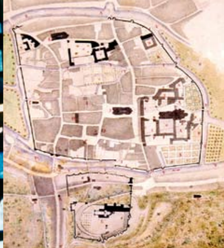
Vendôme au XVII e siècle repris par Gervais Launay au XIX e siècle.