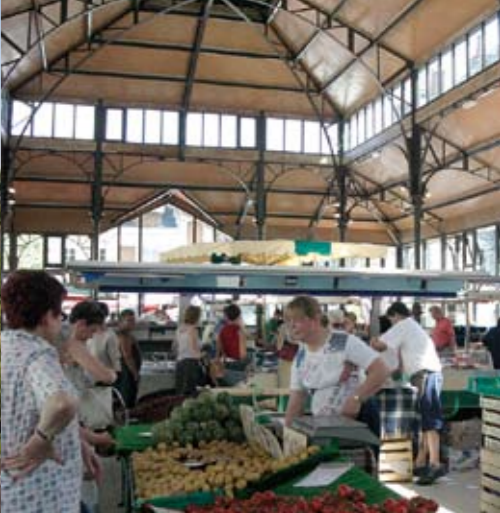
Tous les vendredis, les abords des halles sont animés par un marché.