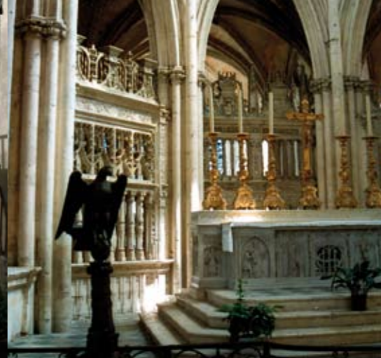
Le choeur de l'abbatiale de la Trinité.