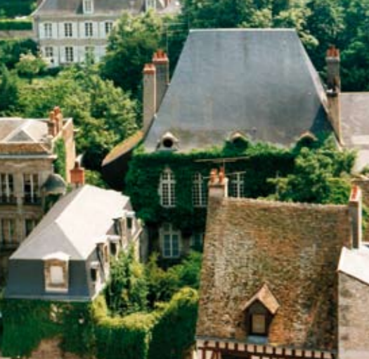
Un des hôtels particuliers de la rue Guesnault a inspiré à Balzac l'histoire de la Grande Bretèche.

Abbé Gabriel Plat (1877-1950) « L'Église de la Trinité de Vendôme » 1934