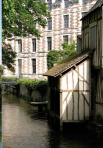
Le lavoir des Cordeliers (fin XV e siècle).