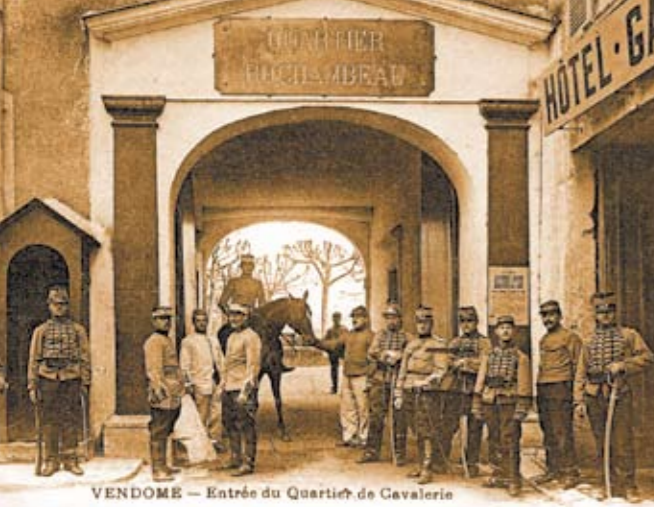
Des soldats du 20 e Chasseurs à cheval, devant le quartier Rochambeau dans l'ancienne abbaye de la Trinité.

De l'ancienne abbaye bénédictine aux portes de la ville, tous ces lieux pittoresques vous content leur histoire.