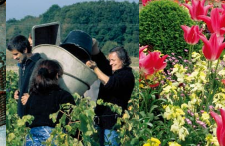
Vendanges de la pente des Coutis.