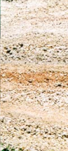
Roches calcaires du coteau sud.