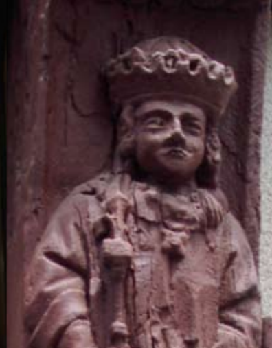
Saint Louis sur la maison Saint-Martin.