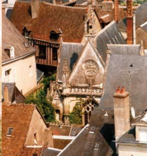
Chapelle privée Notre-Dame-de-pitié.