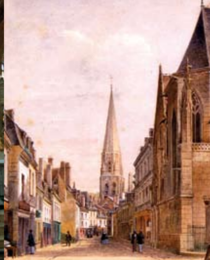
La rue du Change en 1856, aquarelle de Gervais Launay.

2 circuits vous invitent à découvrir le cœur historique de Vendôme. Les 2 parcours partent de l'office de tourisme et se complètent, permettant ainsi de découvrir toute la richesse du patrimoine de la ville. Les parcours sont balisés par des clous dorés fixés au sol.