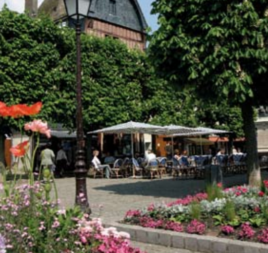
Au cœur de la ville, la place Saint-Martin.

Pierre de Ronsard (1524-1585) "Odelette du Bocage" de 1554 - Livres des odes de jeunesse.