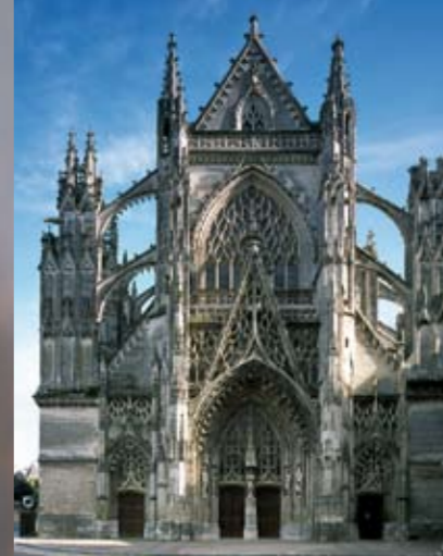
Façade gothique flamboyante de l'abbatiale de la Trinité.