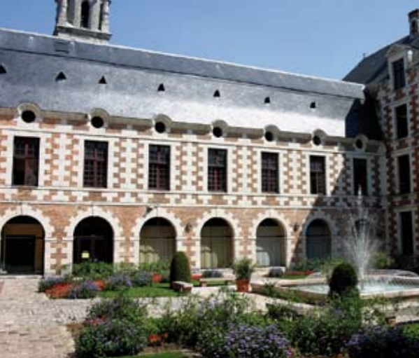
La cour d'honneur de l'hôtel de ville.

De la cour de récréation de l'ancien collège aux platanes vénérables jusqu'aux bords du Loir, découvrez des lieux chargés d'histoire.