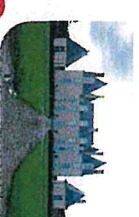
5 Chateau de Villepépoux