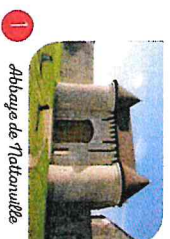
1 Abbatiale de Tatouville

À travers les chemins et routes de Beauce, découvrez des sites patrimoniaux chargés d'histoire ou encore des lieux de mémoire, témoins de la bataille du 2 décembre 1870 à Loigny.