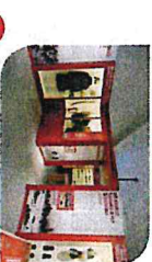
4 Trousse de la guerre de 1870

La Maison du Tourisme peut également vous aider à créer votre parcours personnalisé en fonction de vos attentes, de vos envies, de la durée de votre séjour.