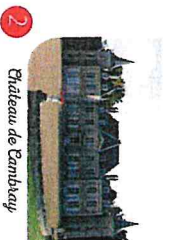
2 Chateau de Cambay