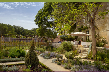
Jardin de curé au Presbytère de Chédigny