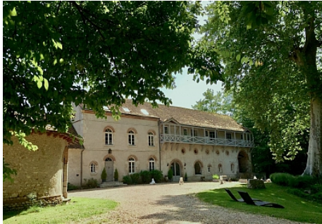
Moulin st Julien