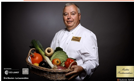
CCI_Ludovic Letot_My Loire Valley