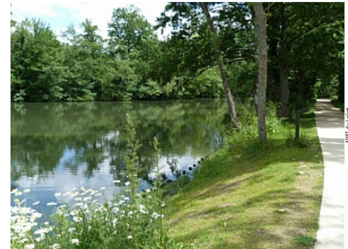
ADRI du Loiret