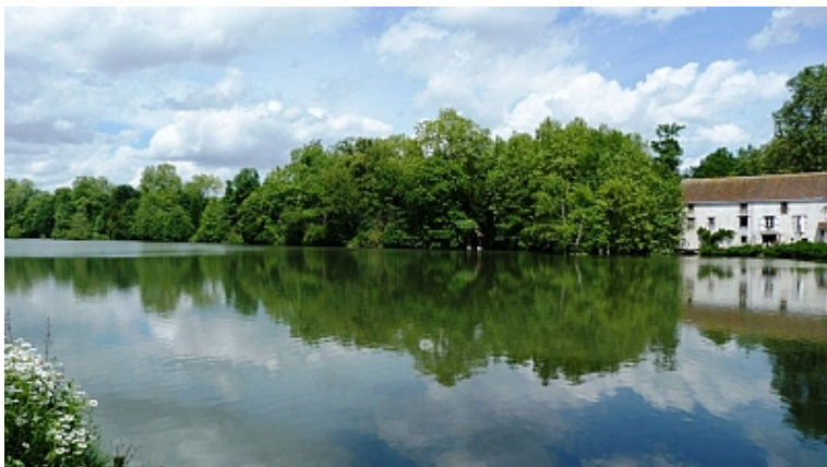
ADRT du Loiret

contact@olivet.fr 02 38 69 83 00 http://www.olivet.fr/