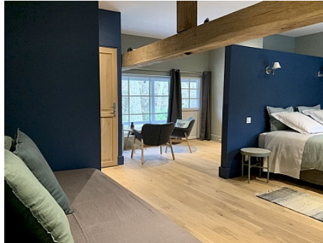
Moulin st Julien