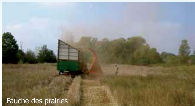
Fauche des prairies

L'intervention la plus importante consiste à empêcher le boisement des îlots à sternes, lors de chantiers de bénévoles ou d'interventions mécaniques confiées à une association d'insertion, afin de les garder propices à la reproduction des oiseaux.