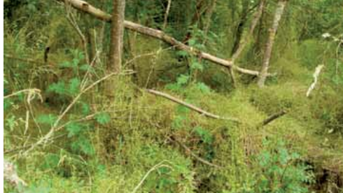
Le boisement alluvial, une jungle miniature

C'est quand le boisement remplace de façon trop importante tous les milieux (grèves, pelouses, prairies) que la question d'une intervention humaine se pose.