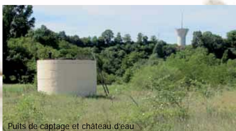
Puits de captage et château d'eau