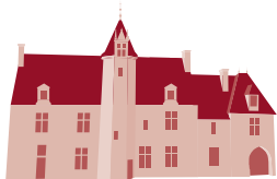
Maison natale de Pierre de Ronsard Couture-sur-Loir Vallée-de-Ronsard