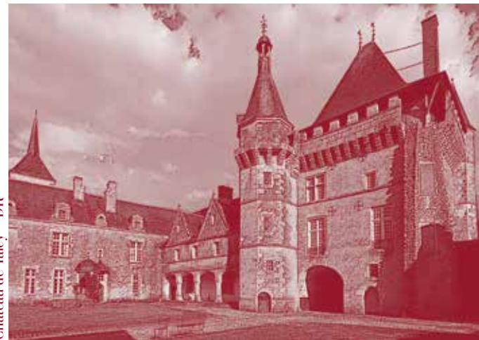
Château de Talcy

Jauge limitée donc réservation conseillée – Renseignements : chateau-talcy.fr