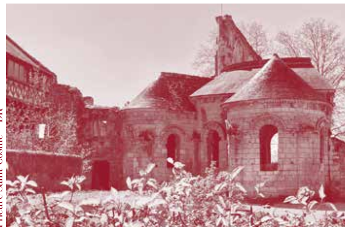
Prieuré Saint-Cosme