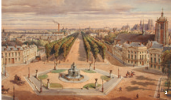
1. Projet d'aménagement de la porte Bannier à Orléans , vers 1851, aquarelle sur papier, par Charles Pensée. Hôtel Cabu-musée d'Histoire et d'Archéologie d'Orléans