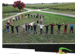
1936/2016 Les Vignerons de Quincy lors du 80ème anniversaire de l'AOC.