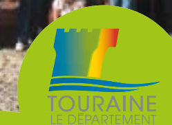
impression et réalisation : Imprimerie Cd 37, édition janvier 2017. Extrait du Sean 25 convention IGN4000970 - N°199