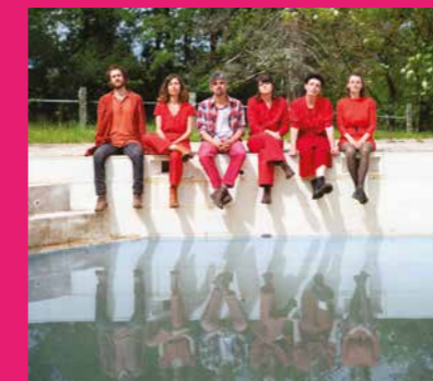
BACK AND FORTH et GOLIATH

22h45 : DJ Dgé Puisant dans les tubes universels des années 60 à aujourd'hui, DJ Dgé vous sert un cocktail de ses meilleurs vinyles. Sortez vos paillettes et venez enflammer le dancefloor !