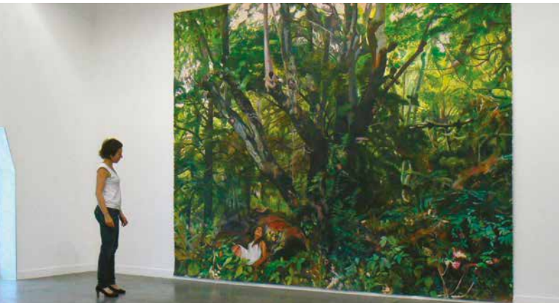
TABLE RONDE 9