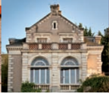
Le manoir de Beaugard

Né en 1781 à Montlouis, Abraham Courtemanche s'engagea dans l'armée et participa à la retraite de Russie de Napoléon.