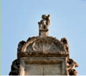
L'Hôtel de la Ramée

De 2 710 habitants en 1954 , la ville a vu sa population augmenter massivement dans les années 60-70 pour compter aujourd'hui plus de 11 000 habitants. La ville a su s'adapter par une urbanisation raisonnée et répondre aux besoins de ses habitants. Elle a ainsi conservé son identité et a créé le concept d'une « petite ville à la campagne où il fait bon vivre ». Son cœur bat, tous les ans au mois de septembre, au rythme de son Festival de Jazz de renommée internationale.