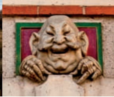
Sculpture - Maison Art Nouveau

Au n° 2 : maison Art Nouveau présentant une façade ornée en son centre d'un grand losange en céramique colorée d'où jaillit