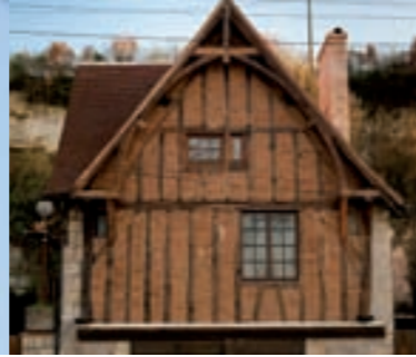
Maison en pans de bois

Ce quai, lieu de nombreux commerces, porte depuis 1918 le nom de l'ancien propriétaire de la Ramée, peintre amateur, qui avait légué une importante somme d'argent à la ville. Au n° 36 : Hôtel particulier de la Ramée inscrit au titre des Monuments Historiques depuis 1973. De style Renaissance comme le Presbytère, il est bâti en moellons de calcaires enduits et non en pierre de taille (réservée aux chaînages d'angles et au décor des baies et lucarnes). À noter ses 2 remarquables