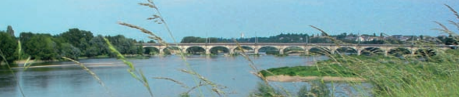
Le fleuve Loire