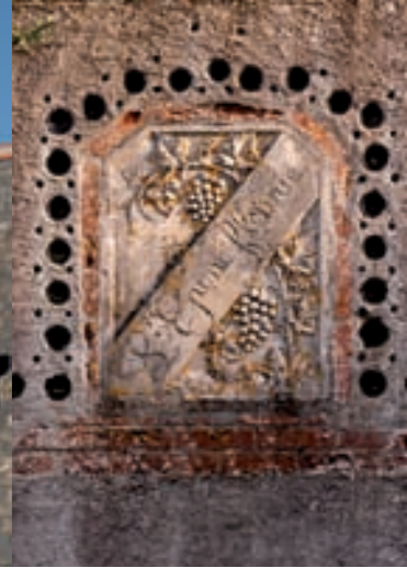
Les caves de l'Épine Fleurie

dans les années 40, puis en 1984, l'édifice a été réaménagé de 1991 à 1995.