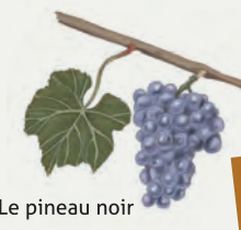
Le pineau noir