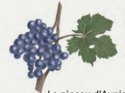
Le pineau d'Aunis

Réponse 1. Le cabernet - 2. Le grolleau 3. Le gamay - 4. Le pinot noir 5. Le pineau d'Aunis