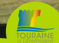
photo © Cd37/Christophe Rambaut - impression et réalisation - Impression Cu 37, édition janvier 2017. Extrait du Scan 25 convention IGN4000970 - N°46