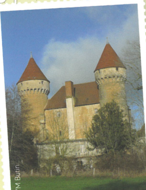
Le Château de Celon