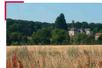
Château de Valesne