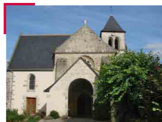
Eglise de Saché